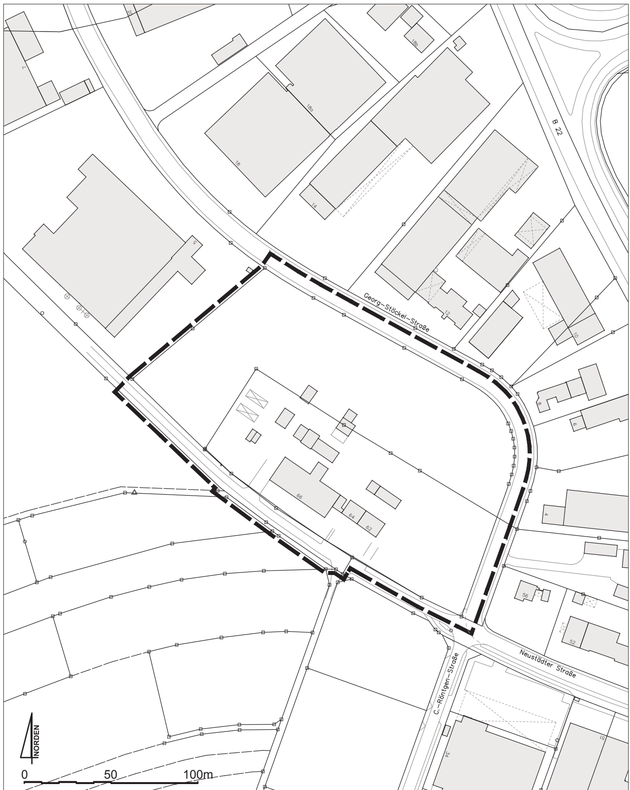
Bebauungsplan 61 26 200 Ä1 "Georg-Stöckel-Str./ Wasserwerk"